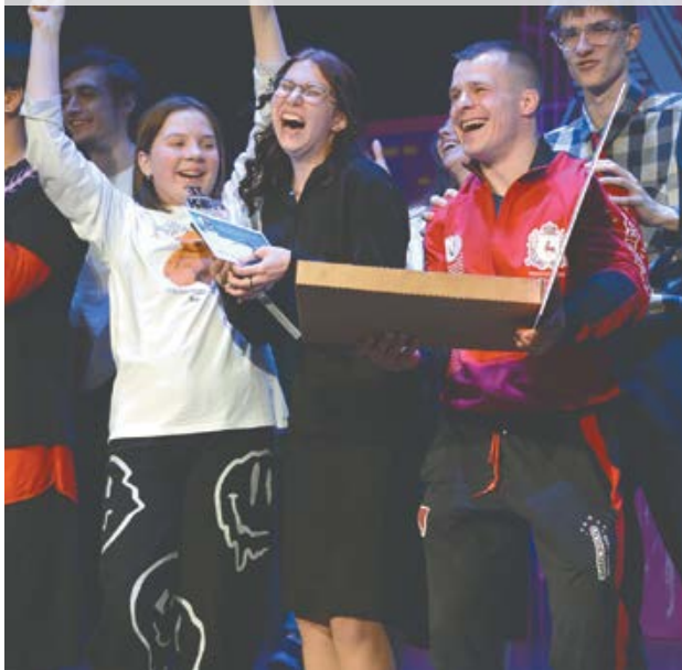
Команда «Какао» (Дзержинск) впервые выступала на выездном фестивале и сразу оказалась в призерах.