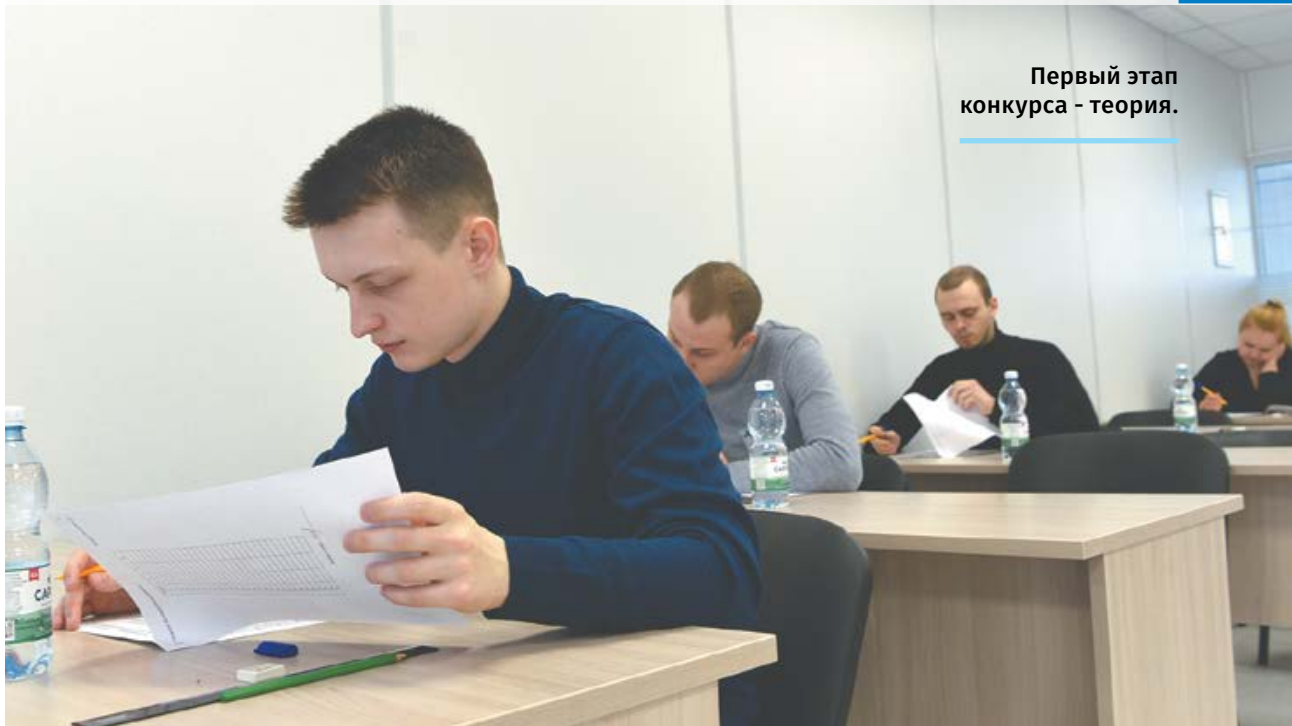
Первый этап конкурса - теория.

Кстати, Александр в общем зачете занял 5 место – для первого раза это неплохо.