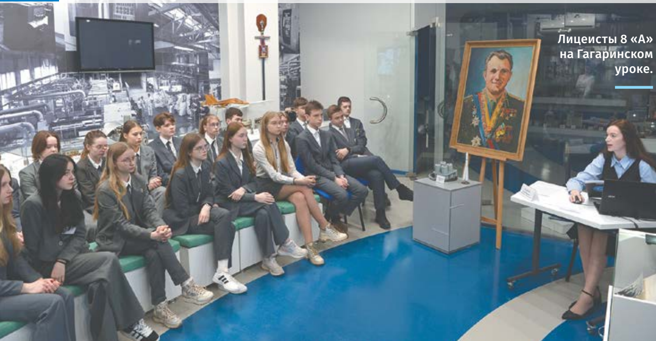
Лицейсты 8 «А» на Гагаринском уроке.