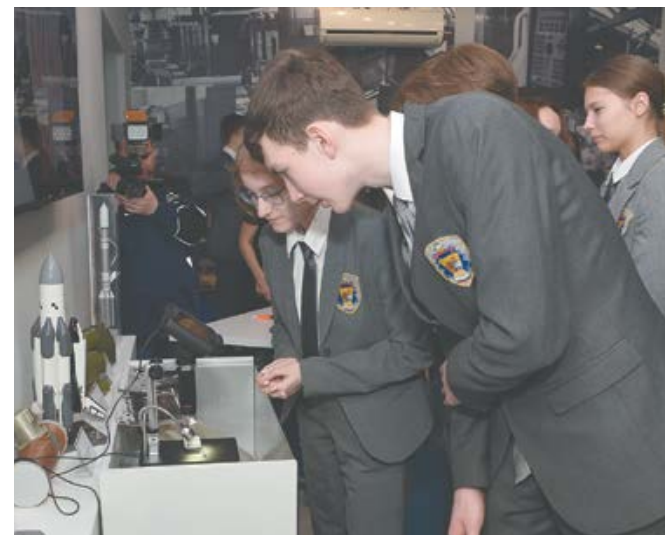
Самое маленькое изделие, выпускаемое на АПЗ, школьники рассматривали под микроскопом.

– Пошел в инженерный класс, потому что увлекаюсь математикой, физикой, дополнительно занимаюсь программированием. Гагаринский урок – интересное мероприятие, раньше не знал, что космонавт Алексей Леонов был в нашем городе. Впечатлила деталь, которую мы рассматривали в микроскоп, в ее составе оказывается, есть маленький кусочек рубина. Поражен, какие на заводе делают мелкие и высокоточные изделия, которые применяются в космических аппаратах.