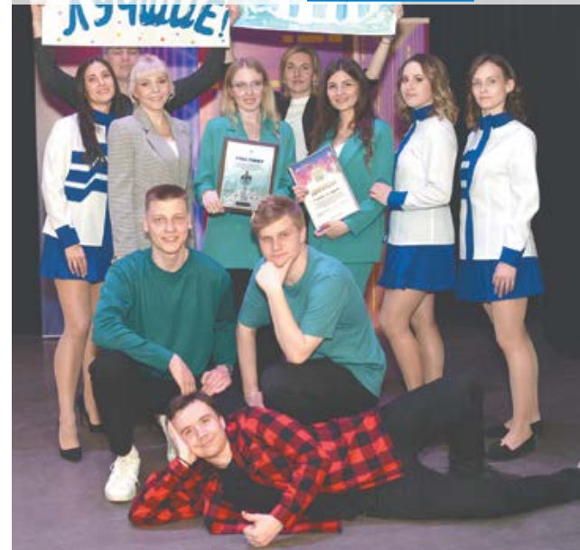
«Сенокос на льдине» с группой поддержки – ребятами из Молодежного совета АПЗ.