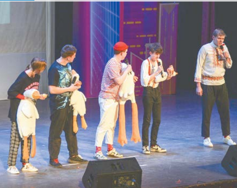
«Арзамальчикам» шутить помогли символы родного города – гуси и лук.